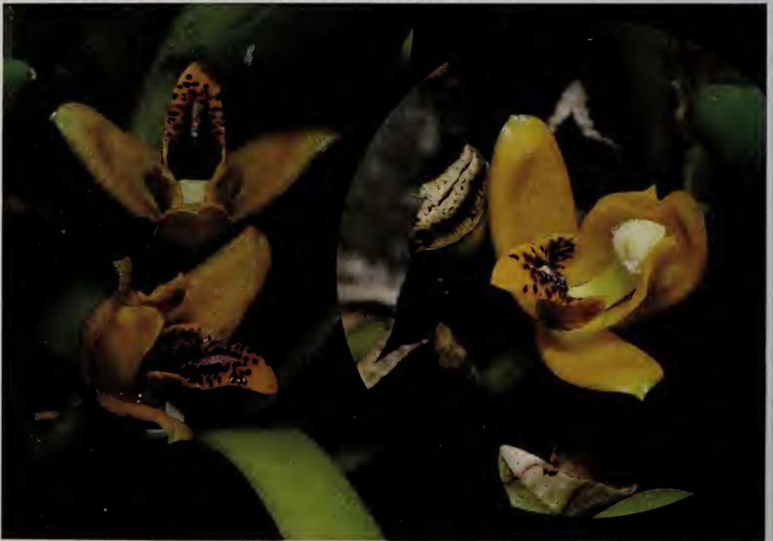
Fig. 1 : Heterotaxis ventricosa

labelle, en forme de quille avec une surépaisseur longitudinale linéaire peu élevée, l'antérieur linéaire, court, s'étalant sur 40% seulement de la longueur totale du lobe médian ; colonne érigée, claviforme, arquée, 9,5 × 2 mm à la base et 4 mm à l'apex, de couleur blanche, marge du clinandre lisse, anthère de forme générale largement ovale, 3 × 3 mm, de couleur blanchâtre, uniloculaire, surface apicale largement papilleuse, pollinies, 4, en deux paires inégales, de couleur blanchâtre, sessiles avec un viscidium rhomboïde à marge irrégulière. Fig. 1 & 2.